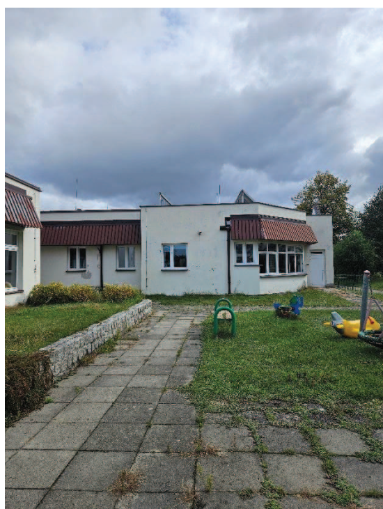
Fot. 3 – Fragment elewacji południowej- zachodniej- - widoczne łamcze światła, które będą demontowane